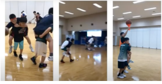
第10回JBA スポーツパフォーマンスライブセミナー 「成長期に合わせたトレーニングの実践」より