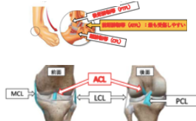
第2回JBAスポーツパフォーマンスライブセミナー 「バスケットボールにおける代表的な怪我に対するアプローチ」より