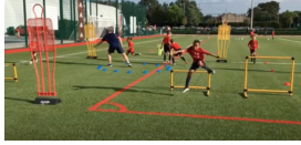
第6回JBA スポーツパフォーマンスライブセミナー 「成長期の育成と実践」より